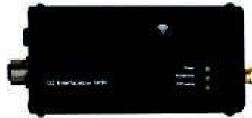
Einstellungen vor Ort über die G2-Interface bearbeiten

Schneller und sicherer Zugriff auf das Gerät wird durch das G2-Interface erreicht, das die direkte Verbindung zum OTT ecoN über einen Webbrowser ermöglicht. Sie können ganz einfach auf Live-Nitratmessungen, interne Datenprotokolle, optische Qualitätsindikatoren und Systemeinstellungen zugreifen. Die internen Daten können zur weiteren Analyse exportiert werden.