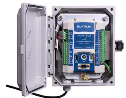
Integration mit einem Datenlogger

Onlinesysteme zur Nitratüberwachung bestehen aus drei Komponenten: dem Nitratsensor, einer Multiparametersonde und dem zentralen Element des Systems, dem Datenlogger. Der OTT ecoN ist in der Lage mit unterschiedlichen Datenloggern zu kommunizieren, z.B. mit OTT netDL, Sutron SatLink3 und XLink. Eine Systemlösung bietet viele Vorteile, angefangen von der Kontrolle des Wischers über Zugriff auf Qualitätsdaten, USB Schnittstelle für vor Ort Kommunikation, WLAN Betrieb für drahtlose Geräte, volle IP Kompatibilität, Datenübertragung via Satellit und Fernwartung.