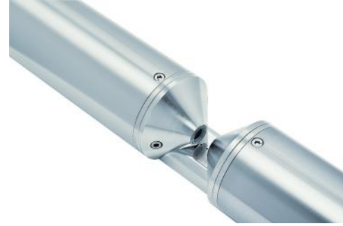
Optische Pfadlänge zwischen Linsen

Wesentlich für die korrekte Messung ist die Pfadlänge zwischen den Linsen, da diese die messbare Nitratkonzentration beeinflusst. Die Pfadlänge sollte der erwarteten Konzentration angepasst sein. Auch andere Einflüsse wie z.B. Trübung sind zu berücksichtigen. Der modulare Aufbau des OTT ecoN bietet den Vorteil, dass die Anpassung des Linsensystems und die Kalibrierung durch Fachpersonal vorgenommen werden kann.