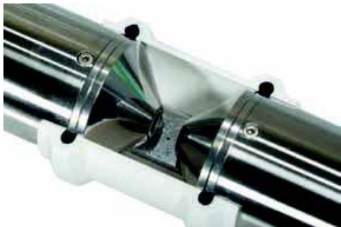
OTT ecoN Nullpunkt überprüfen - VALtub