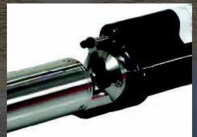
Wischer entfernt Biofouling